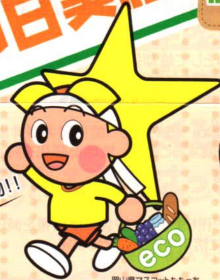
岡山県マスコットももっち