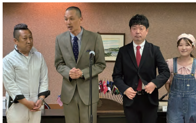
左から、盛り上げてくれた「フロントライン」さん、「まつはましん」さん、「わぁ」さん