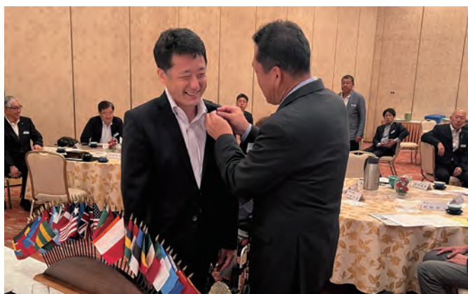
前会長より新会長へゴング並びにバッジ引渡式