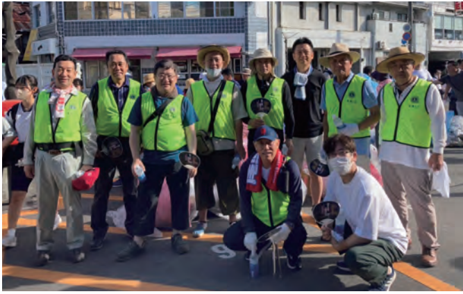
清掃活動に参加した皆さん