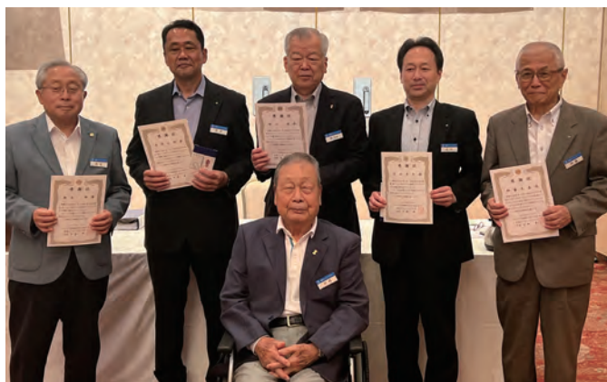
前年度役員に感謝状並びに記念品贈呈