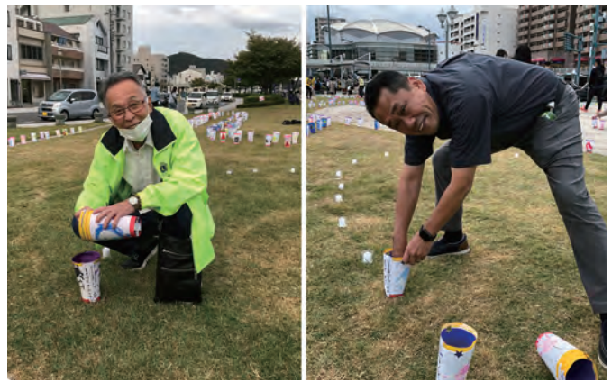
尾道灯りまつりに協力