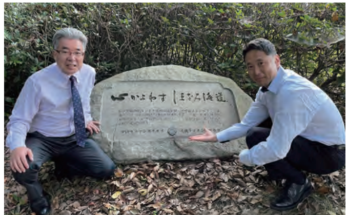
今治LC・尾道LC合同植樹の記念碑清掃