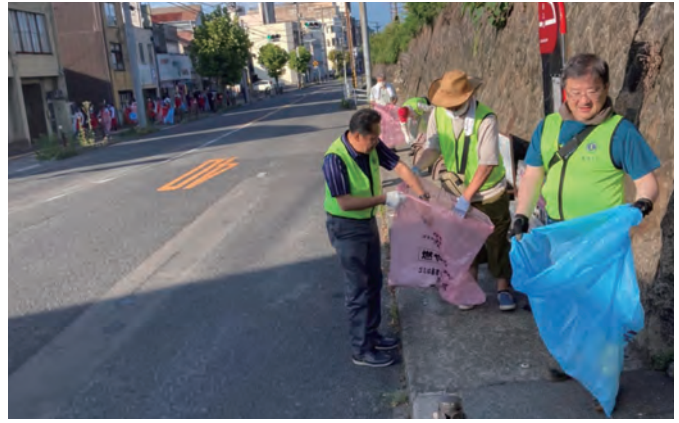
早朝清掃活動に参加