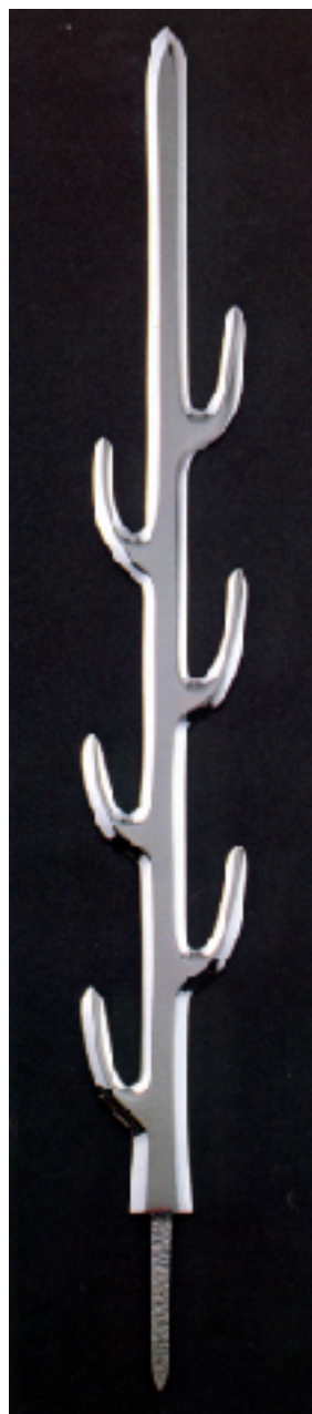
「七支刀」復元レプリカ 大阪府立近つ飛鳥博物館図録より

法律の大学を卒業したのち専門知識もないまま電気バリカンの製造事業の世界に飛び込んだ私は、地元大学の工学部や公立の研究機関、図書館に繁く通いながら仕事のなかでの骨身にしみる失敗を重ねることで、皮相ではあるものの機械工業の基礎的な知識をどうにか身につけることが出来た。その頃、あれほど苦手だった化学や物理に関わる見識の如何（いかん）が、自分の明日の糧（かて）を左右するという皮肉な日々を送っていた。怠慢と努力の結果は「成績表」ではなく、事業の月々の「損益表」に明快に表れた。工業、とりわけ金属加工技術についての知見が深まるにつれて、高校以来意識の底にあった七支刀、その卓抜した製作技術や歴史への関心が私のなかで首をもたげてきた。