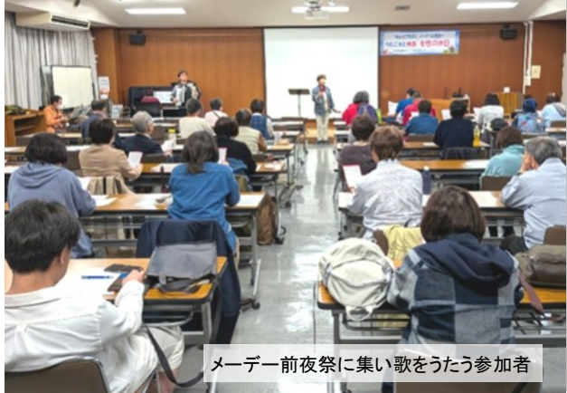
メーデー前夜祭に集い歌をうたう参加者

第22回県内の自治体・公務員職場ではたらく女性の学習交流集会 ●6月7日(日)9時・広島市役所集合～車分乗で呉市へ ●内容:日鉄呉跡地フィールドワーク ●14時・広島市内着予定 ●お問い合わせ・広島自治労連