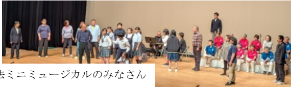
憲法ミニミュージカルのみなさん

2部構成である集会の第一部は、憲法ミニミュージカル「声を上げよう! 2026」を公演。広島への修学旅行を舞台に、明るくコミカルな展開の中にも、平和や憲法の大切さを訴え、最後に「憲法賛歌」を歌い締めくくるストーリーはとても素晴らしいものでした。