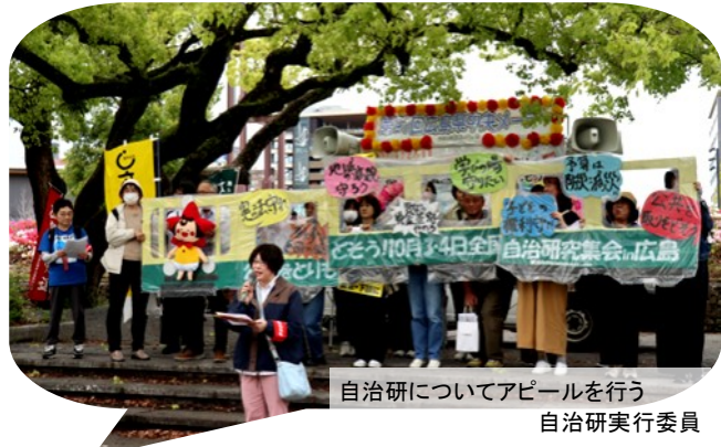
自治研についてアピールを行う自治研実行委員

実行委員会(事務局広島自治労連)が「公共を取りもどし、住民も公務員労働者も誰もが幸せに暮らしつつげられる町づくりを」をテーマに、「憲法守れ」「戦争する国づくり反対」「子どもの権利を守れ」等8本のアピールを、デモレーションに応募したイメージキャラクター「もみじちゃん」、段ボールで作成した市内電車で見覚的にも訴えました。