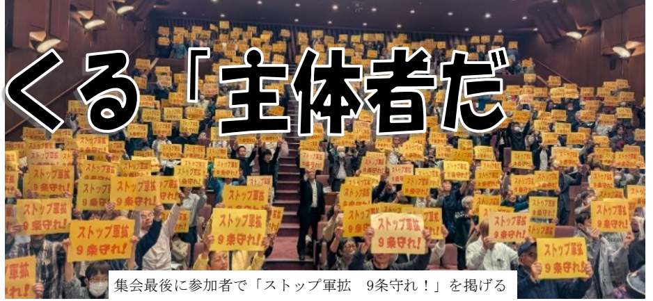
集会最後に参加者で「ストップ軍拡 9条守れ！」を掲げる

5月3日(土)広島県民文化センターで、「戦争させない・9条壊すな! ヒロシマ総がかり行動実行委員会 憲法集会実行委員会」主催、「5・3 憲法集会」が開催され、会場530人とオンライン88人合わせ630名以上が参加しました。憲法ミュージカルと記念講演を通じて、ひとり一人が平和をどう実現させるのか考えていくパワーがある、と実感する場となりました。