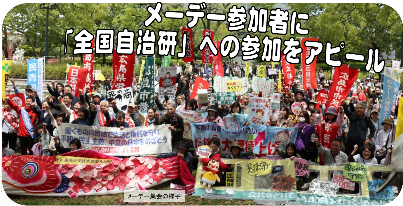
メーデー集会の様子