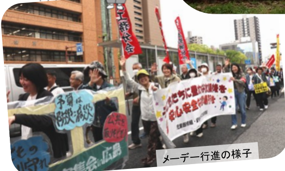
メーデー行進の様子