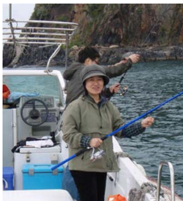
アジ釣り大会の様子

ただ、平成23年度は天候不良などにより、まだ1回しか開催できていません。しかしその唯一開催した船からのアジ釣り大会には、たくさんの参加者が集まりました。釣果も良く、大量のアジを釣ることができました。