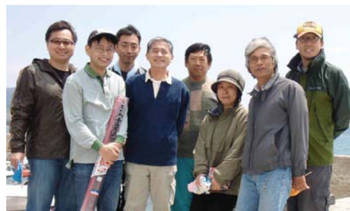
かなこぎ会メンバー

私たちかなこぎ会は、病院内の釣り好きな職員が集まって活動しており、年に数回釣り大会を開催しています。