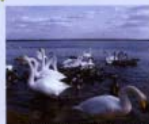
⑥ついで湖 1991年12月 310ha