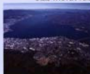
⑫琵琶湖 1993年6月 65,602ha