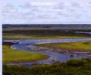
②森多木沼原 1993年6月 2,904ha