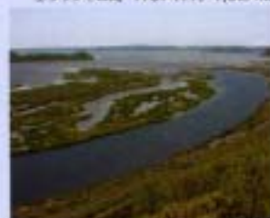
③摩多湖・池原辺牛池原 1993年6月 4,896ha