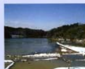
⑩片野池 1993年6月 10ha