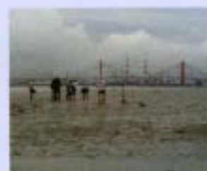
⑪静の干潟 2002年11月 323ha