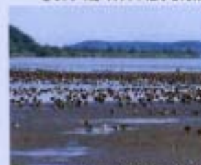
⑦伊豆新・内沼 1985年9月 559ha