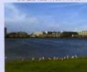
⑨谷津干潟 1993年6月 40ha