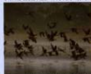
⑤宮島 2002年11月 41ha