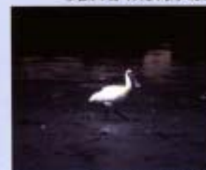
⑬瀨湖 1999年5月 58ha