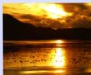
⑧佐田 1996年3月 76ha