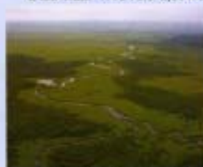
④朝日湖 1980年6月 7,863ha