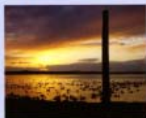
①ウツチャロ湖 1989年7月 1,607ha